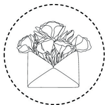
Stap 1: Formulier

Het verzenden van jouw speciale bloemen lijkt een spannende taak, maar wij van Semper Flores zijn er om je er doorheen te loodsen! We nemen je stap voor stap door het proces zodat jouw bloemen zo vers mogelijk bij ons komen om ze te vereeuwigen.