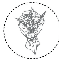
Stap 3: Bloemen inpakken